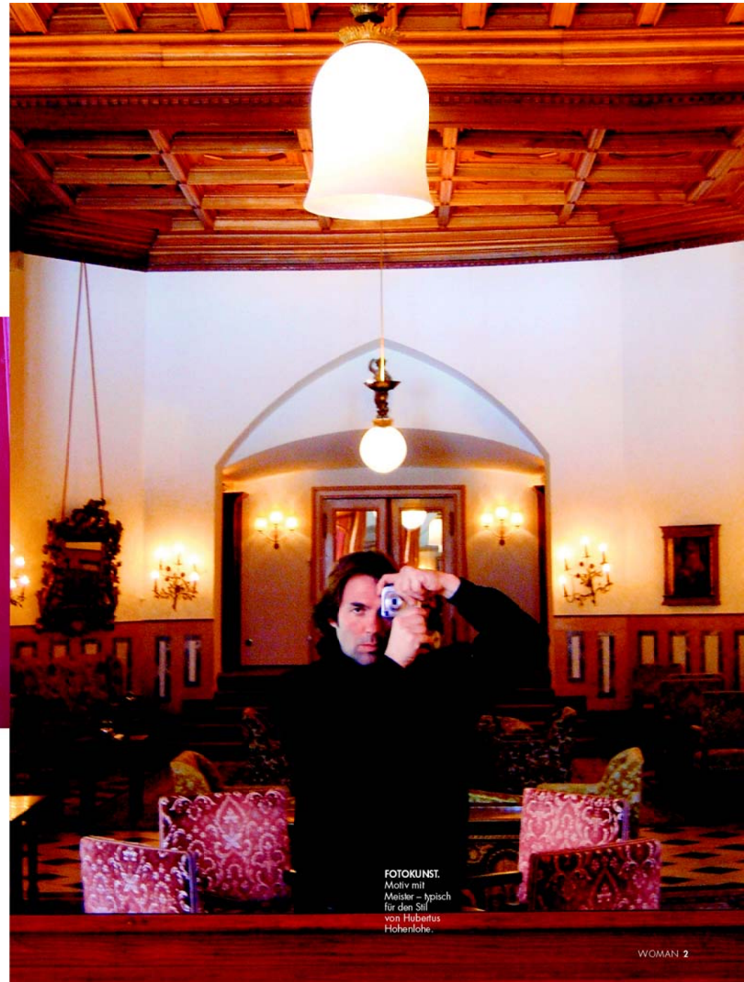
FOTOKUNST. Motiv mit Meister – typisch für den Stil von Hubertus Hohenlohe.