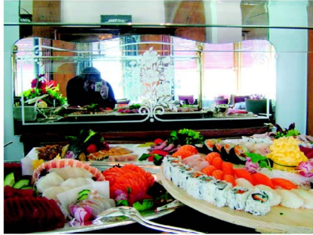
EINFACH KÖSTLICH. Sushi-Traum im hoteleigenen NOBU-Restaurant.