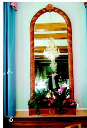
1 BERGPORTAIT. Hohenlohe auf der Palace-Terrasse ... 2 TV-STAR. ... und als Spiegelbild im Flatscreen. 3 BILD-REICH. Hubertus als Teil der Fotogalerie. 4 PRIVAT-SPHÄRE. ...und in einem der 165 Zimmer. 5 SPIEGLEIN. Der schönste im ganzen Hotel? Natürlich Fotokünstler & Jetsetter Hubertus Hohenlohe!