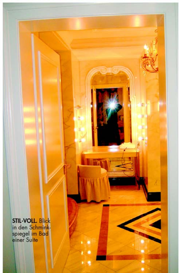
STIL-VOLL Blick in den Schminkspiegel im Bad einer Suite

Aber man muss raus ins Alpenmeer. Denn auch in dieser genialen Hotelumgebung beschleicht einen früher oder später dieses 5-Star-Syndrom: